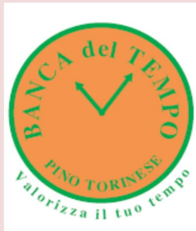
BANCA DEL TEMPO Pino Torinese

La scuola ha scambiato con la Banca l'utilizzo di spazi da destinare ad attività di carattere sportivo e culturale dedicate ai Soci.