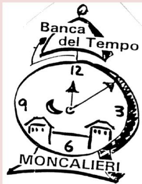
BANCA DEL TEMPO Moncalieri

❖ La Banca del Tempo Moncalieri ha raggiunto i seguenti OBIETTIVI :