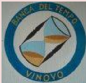
BANCA DEL TEMPO Vinovo

❖ La Banca Del Tempo Vinovo ha esaminato il contesto territorial e e demografico del Comune di Vinovo, dove è emerso una forte dispersione degli abitanti sul territorio e una forte presenza di popolazione anziana.