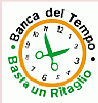
BANCA DEL TEMPO San Salvario

➡ Indagare e riflettere sul significato del l o scambio non monetario nel contesto del quartiere di San Salvario, considerando l a tipologia di soci che negli ultimi anni si sono avvicinati al l a banca del tempo (donne migranti, giovani studenti, lavoratori precari, ragazzi disoccupati, pensionati...) e il tipo di territorio in cui l a Banca è inserita.