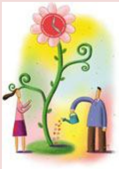
BANCA DEL TEMPO "Tempo al Tempo"

❖ La Banca Del Tempo di Torino "TEMPO AL TEMPO" ha colto l'occasione di prender parte a questo percorso per due motivazioni: